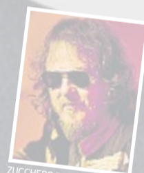
ZUCCHERO FORNACIARI. 64 ANNI. VINCE IN TRIBUNALE