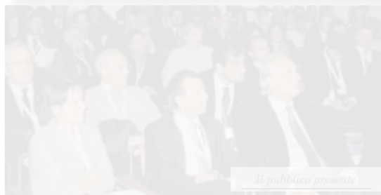
Il pubblico presente