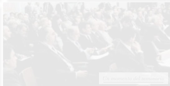
Un momento del seminario