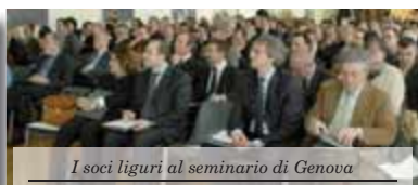
I soci liguri al seminario di Genova