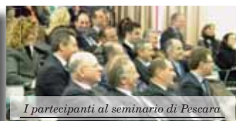
I partecipanti al seminario di Pescara