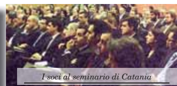
I soci al seminario di Catania