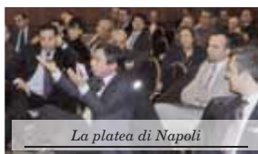
La platea di Napoli

Sempre nell'ambito della formazione targata Anasf, è in partenza un nuovo ciclo di corsi di specializzazione e aggiornamento professionale aperti a promotori finanziari e professionisti del risparmio, soci e non soci, con contributo alle spese. I corsi sono accreditati per il mantenimento della certificazione efa TM ed efp TM . La didattica di ogni corso, affidata a esperti del settore e docenti universitari, è realizzata in collaborazione con enti di formazione specialistica e società di consulenza come Sda Bocconi e Progetica. Su www.anasf.it tutti i dettagli su seminari e corsi di specializzazione.