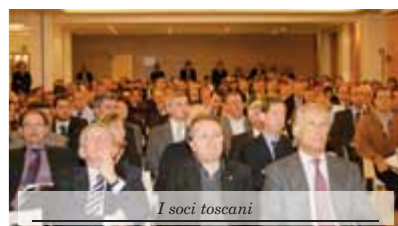
I soci toscani

bilire una relazione produttiva ed efficace con il risparmiatore nelle fasi di sensibilizzazione, realizzazione e mantenimento della pianificazione finanziaria personale.