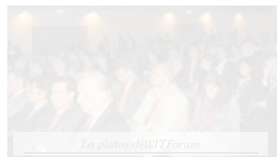
La platea dell'ITForum