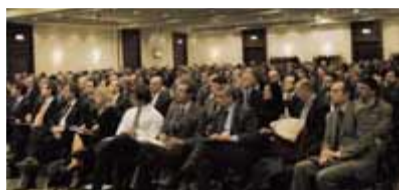
I partecipanti al seminario di Torino