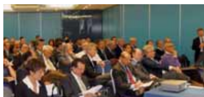
L'aula di Bergamo