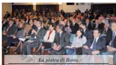
La platea di Roma